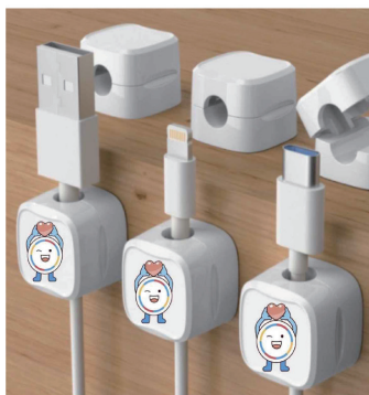
청백이 권익이 케이블 홀더